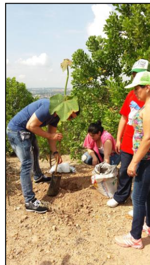
Foto 6 Siembra de árbol