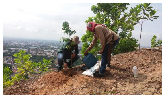
Foto 8 Dagma y Funvima realizando siembra