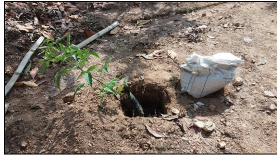
Foto 2 Terreno preparado