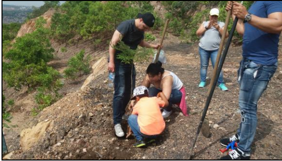
Foto 9 Fomentando a la niñez prácticas ambientales