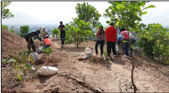
Foto 3 Actividad de siembra