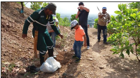
Foto 5 Acciones amigables con el ambiente