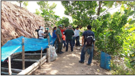
Foto 1 Charla ambiental