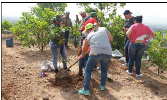
Foto 7 Voluntarios realizando siembra