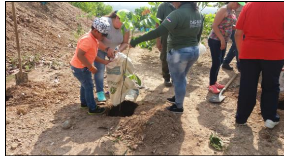
Foto 4 Siembra con tierra abonada