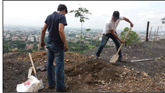
Foto 10 CARVAL realizando siembra